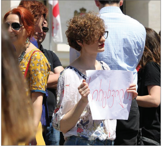
საპროტესტო აქცია აფგან მუხთარლის მხარდასაჭერად. 30 მაისი, 2017.

2017 წლის 30 მაისს მუხთარლის გაუჩინარების ფაქტზე აღძრულ სისხლის სამართლის საქმეზე კვლავ მიმდინარეობს გამოძიება. სისხლის სამართლის საქმის გამოძიება არაეფექტიანად მიმდინარეობს მასში არსებული მასალების და გამოძიებაში არარსებული პროგრესის გამო. არის რამდენიმე მიმართულება, სადაც ჩანს საგამოძიებო უწყებების მუშაობის ხარვეზები და ჩავარდნები, რაც გამოძიებას ხდის არაეფექტურს და მიკერძოებულს. კერძოდ: