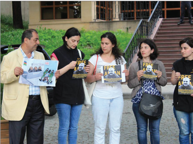
საპროტესტო აქცია აფგანის მხარდასაჭერად. 30 მაისი, 2017.

აფგან მუხთარლი და მისი ცოლი თავიდანვე აცხადებდნენ, რომ აფგანი საგარეუდოდ ქართული პოლიციის ფორმაში ჩაცმულმა ადამიანებმა გაიტაცეს, რომლებიც ქართულად საუბრობდნენ. 19 2017 წლის 9 ივნისს, აზერბაიჯანის პარლამენტის ადამიანის უფლებათა კომიტეტის თავჯდომარის მოადგილე ელმან ნასიროვის რადიო თავისუფლებისთვის მიცემულმა ინტერვიუმ კიდევ უფრო გაამყარა ეს ეჭვები; მან განაცხადა, რომ აფგან მუხთარლის დაკავება აზერბაიჯანულ-ქართული სპეცსამსახურების ერთობლივი მუშაობის შედეგია (მოგვიანებით მან უარყო აღნიშნული